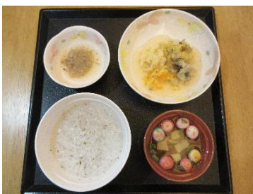
主食：軟飯 副食：キザミ