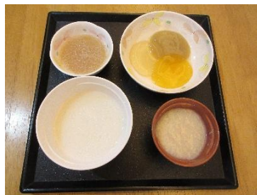
主食・副食：ミキサー食