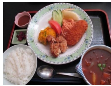
料理長 おまかせ献