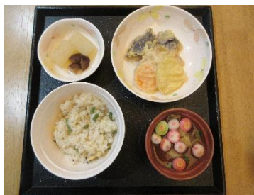
主食：米飯 副食：常食