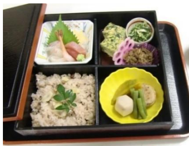
敬老の日 お祝い膳