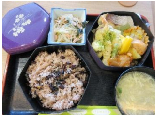
敬老祝賀会 お祝い膳