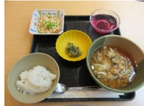
主食：軟飯 副食：キザミ