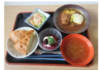
料理長おまかせ献立