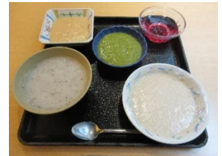
主食：軟飯 副食：キザミ