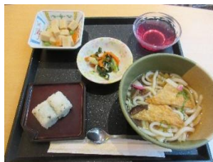
主食：米飯 副食：常食