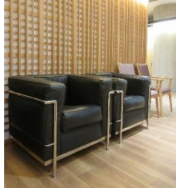
【ホール内ソファー】